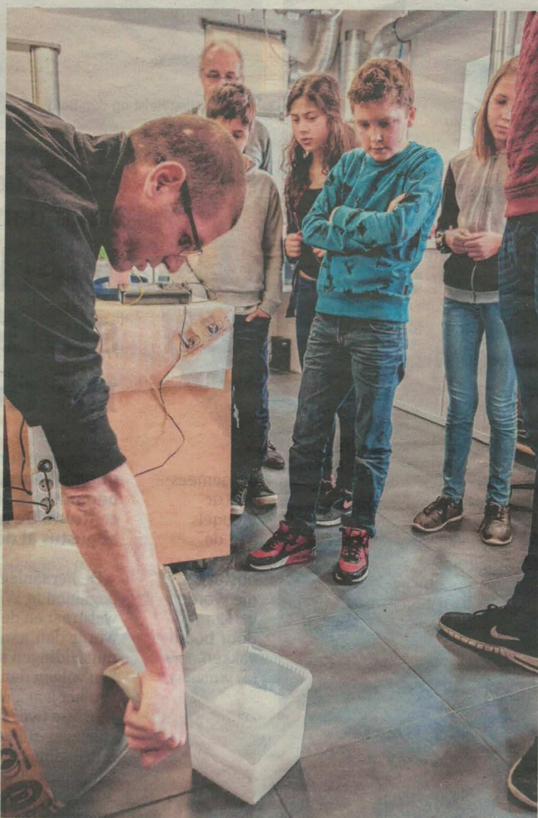
De leerlingen mogen na de rondleiding zelf aan de slag met ballonnen, colablikjes en stikstof.

"Het is dus belangrijk dat we hen nu al, op jonge leeftijd, warm maken om voor STEM-richtingen (technologische, technische, exact-wetenschappelijke en wiskundige richtingen, red.) te kiezen", vervolgt Schwartz. "Van de 45 werknemers zijn er nu zo'n tien bezig